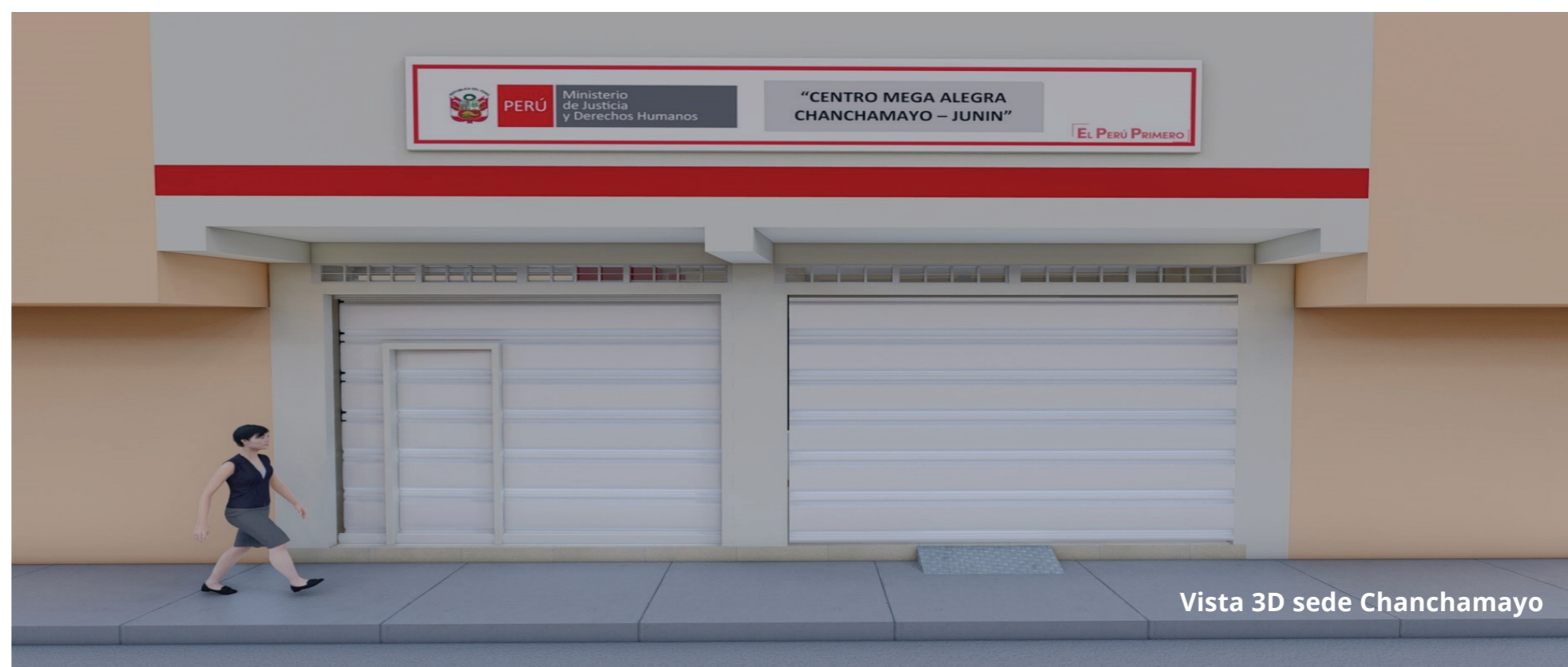
Vista 3D sede Chanchamayo