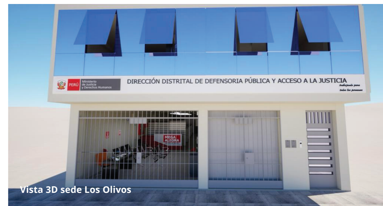
Vista 3D sede Los Olivos

Para el año 2024, el Programa Eje No Penal tiene programado realizar el acondicionamiento físico de las sedes ALEGRA y Mega ALEGRA de Kaquiabamba y Andarapa en Andahuaylas, Pasco, Majes y Camaná en Arequipa, Maynas en Iquitos, Tacna y Huánuco, con lo cual reafirma su compromiso de continuar apoyando a los centros ALEGRA de la Defensa Pública en beneficio de la población que no está en condiciones de pagar un abogado privado, garantizando su derecho a la Justicia.