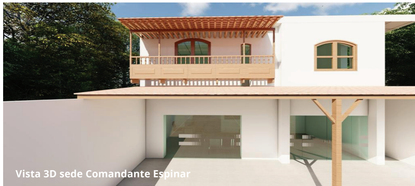
Vista 3D sede Comandante Espinar