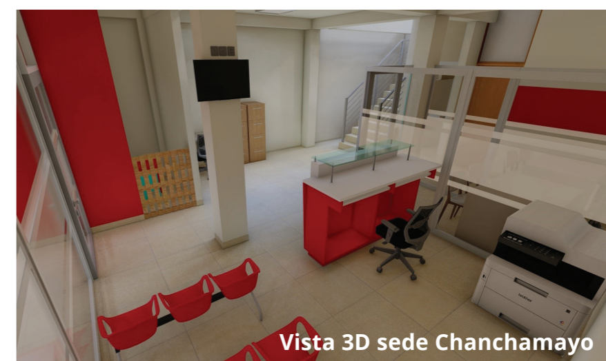
Vista 3D sede Chanchamayo