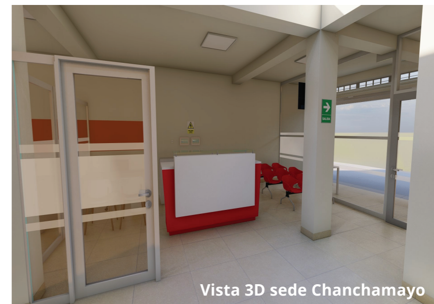
Vista 3D sede Chanchamayo