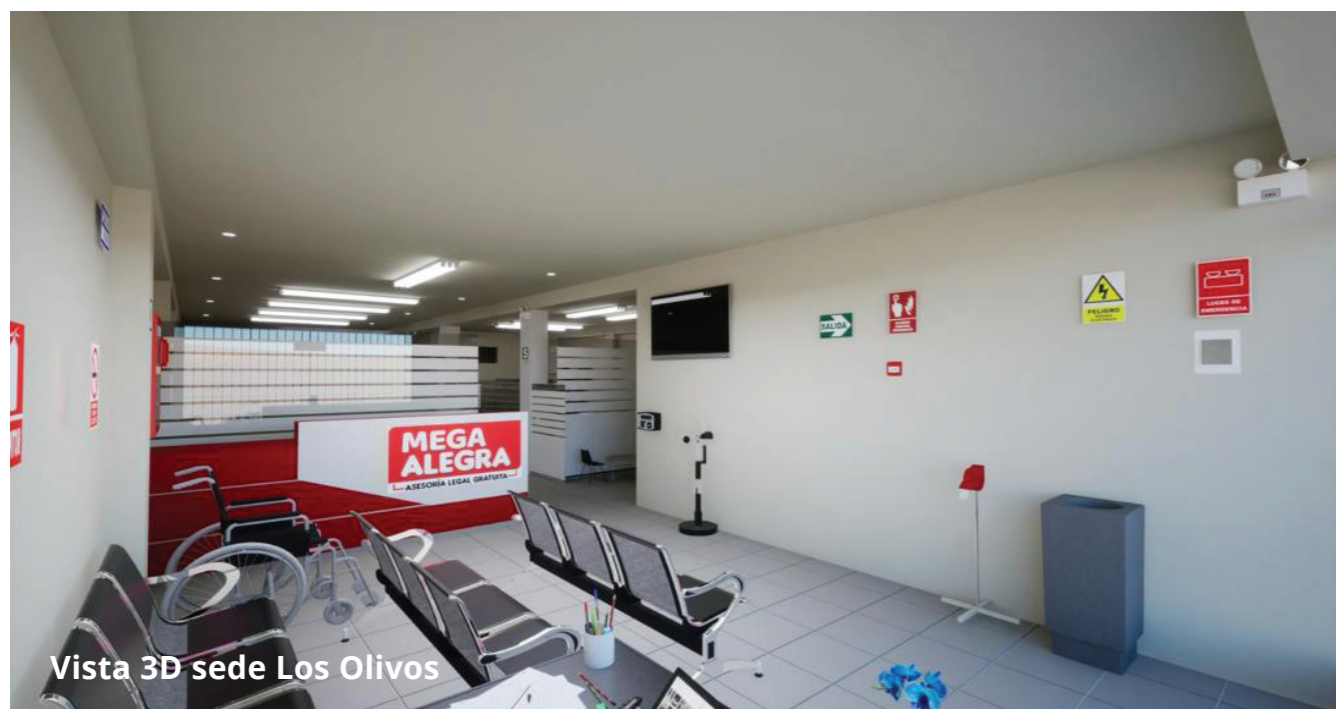
Vista 3D sede Los Olivos