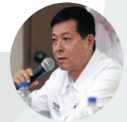
Eduardo Arana Ysa Ministro de Justicia y Derechos Humanos

Este primer Mega Alegra con enfoque intercultural marca un hito importante, se garantizará la protección de los derechos de más de 32.000 habitantes de nuestras comunidades indígenas, se acortará la brecha idiomática y se respetará su diversidad cultural”.