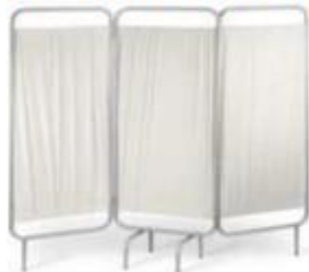
Imagen N° 07 – Biombo metálico referencial

“Decenio de la igualdad de oportunidades para mujeres y hombres” “Año de la unidad, la paz y el desarrollo”