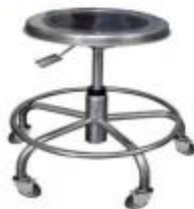
Imagen N°06 – Taburete rodable referencial