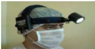
Imagen N° 05 – Lámpara referencial

Año de la unidad, la paz y el desarrollo