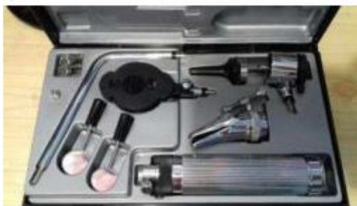
Imagen N° 04 – Pantoscopio referencial