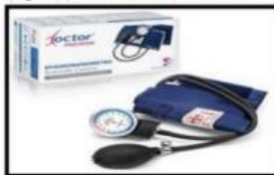
Imagen N° 08 – Tensiómetro referencial