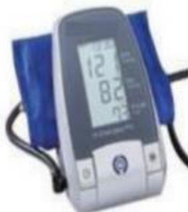
Imagen N° 09 – Tensiómetro digital referencial