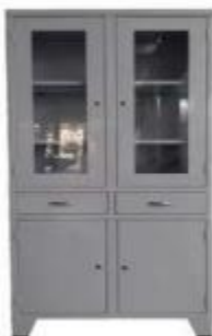
Imagen N°03 – Vitrina de Metal referencial.

La vitrina de metal permitirá guardar los implementos necesarios como riñoneras, conteniendo gasa, alcohol, algodón, espejos, así como guardar cualquier otro artefacto médico bajo seguridad. Cada puerta debe contar con llave.