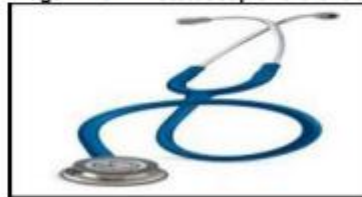
Imagen N°01 – Estetoscopio referencial