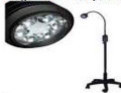
Imagen N°02 – Lámpara referencial