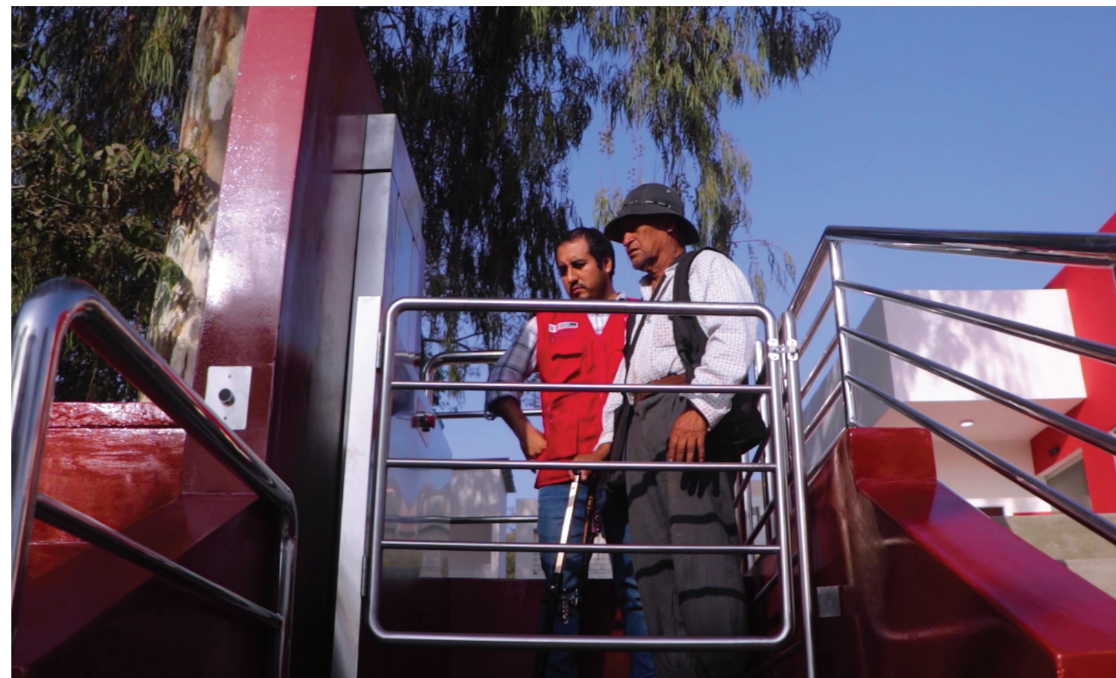
El nuevo centro ALEGRA de Comas, cuenta ahora con un ascensor y rampas de acceso para personas con discapacidad.

ción con los que a su vez se implementa un sistema de seguridad, mobiliario nuevo, y todo ello redundará en favor de los usuarios que acuden al Centro ALEGRA Comas quienes encontrarán mejores áreas de acceso, incluido un elevador para personas con discapacidad motora y un área de juegos para los hijos de las madres que nos visitan. Todo gracias a las obras que se realizaron en el marco del proyecto "Mejoramiento de los servicios de Asesoría Legal Gratuita (ALEGRA)", que se ejecuta