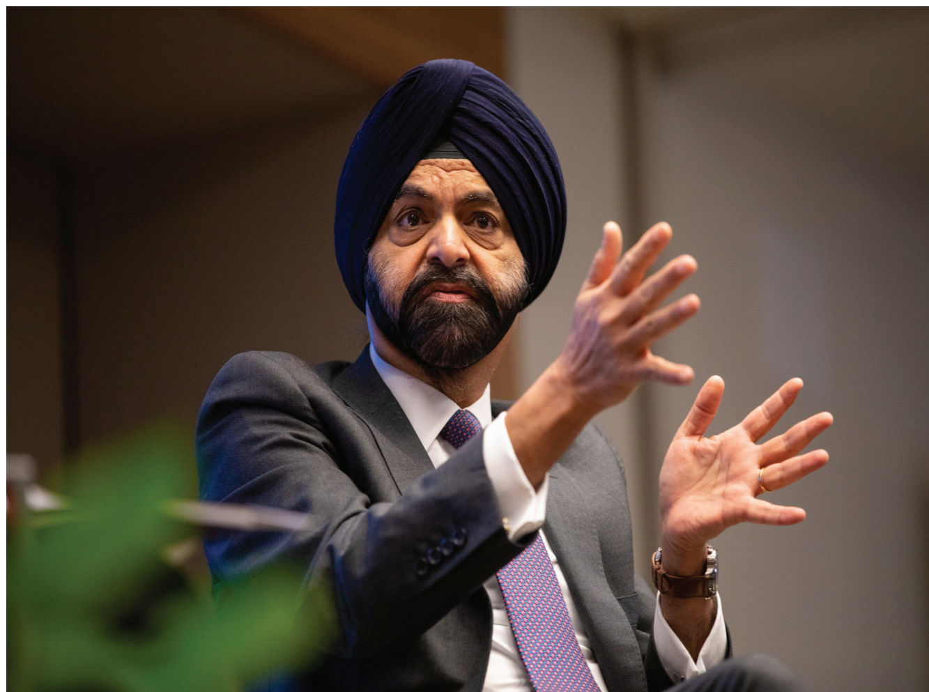
Presidente del Banco Mundial, Ajay Banga de 63 años quiere diseñar una nueva hoja de ruta para la institución internacional.

Ajay asumió la presidencia del Banco Mundial el pasado 02 de junio de 2023. Los medios internacionales informaron que lo primero que solicitó a los funcionarios del Banco Mundial fue que redoblen esfuerzos para encarar los desafíos globales. El empresario indio estadounidense quiere marcar una nueva hoja de ruta en la institución que está a punto de cumplir los 80 años de fundación.