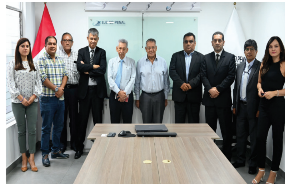
Reunión de trabajo entre el Poder Judicial, el Tribunal Constitucional y el equipo de Eje No Penal.

El programa de mejoramiento y modernización de los servicios de justicia a través de la implementación del expediente judicial electrónico - Eje No Penal, avanza de manera rápida e inexorable no solo mediante la DIGITALIZACIÓN, sino fundamentalmente mediante un proceso de coordinación que se viene llevando a cabo entre las instituciones que conforman el sistema