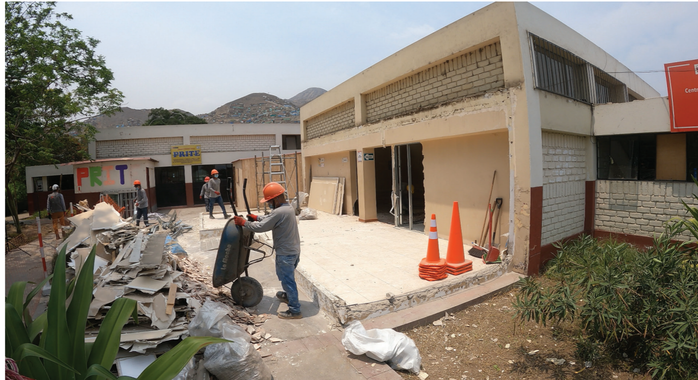
Obra de mejoramiento en la sede Comas del centro Alegra ubicado en Lima Norte.

El centro Alegra de Lima Norte esta proximo a cumplir diez años de funcionamiento atendiendo miles de casos como pensión de alimentos, filiación, defensa de víctimas. Con la inversión del Programa Eje No Penal - Banco Mundial se mejorará la calidad del servicio dirigido a los más vulnerables.