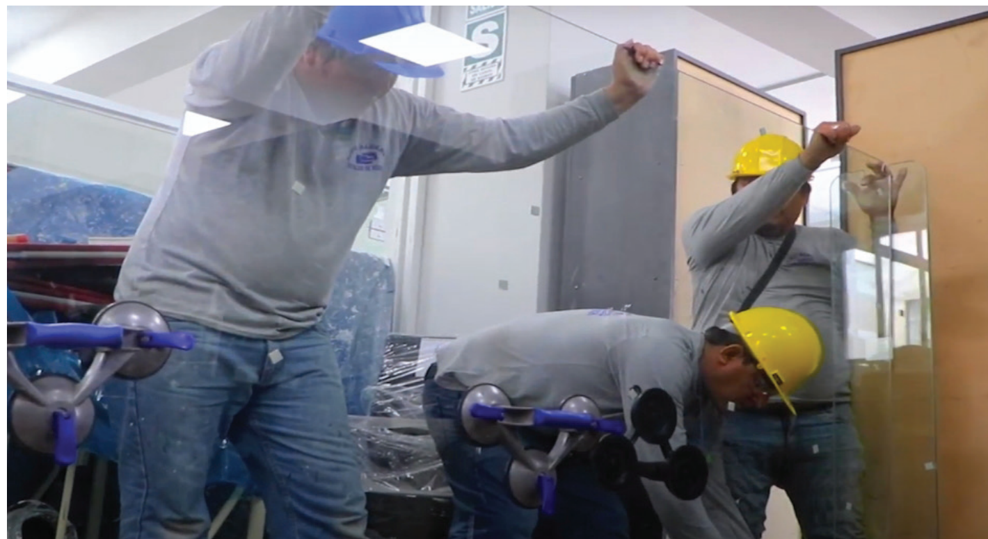
La inversión para las mejoras de los centros ALEGRA, superan los 700,000 soles.

El Programa de Mejoramiento de los Servicios de Administración de Justicia Eje No Penal, hizo posible gracias al apoyo técnico y financiero del Banco Mundial, las rehabilitaciones físicas de cinco centros ALEGRA y Mega ALEGRA que se encuentran ubicados en los distritos de: Cercado de Lima, Villa María del Triunfo, Villa El Salvador, San Juan de Miraflores y Santa Anita.