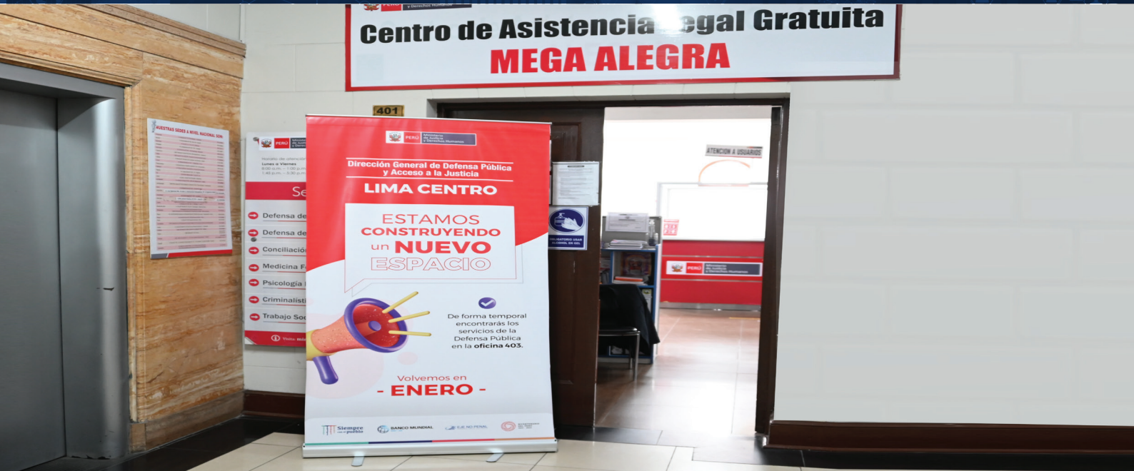
El Programa Eje Penal, ha empezado el mejoramiento físico de cinco sedes ALEGRA ubicadas en los distritos de Lima centro, Villa El Salvador, San Juan de Miraflores, Villa María del Triunfo y San Anita.