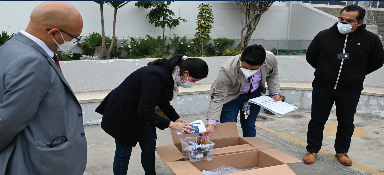
13 kits de muñecos asexuados para determinar los trastornos emocionales, conductuales, de abuso sexual en niños y niñas.