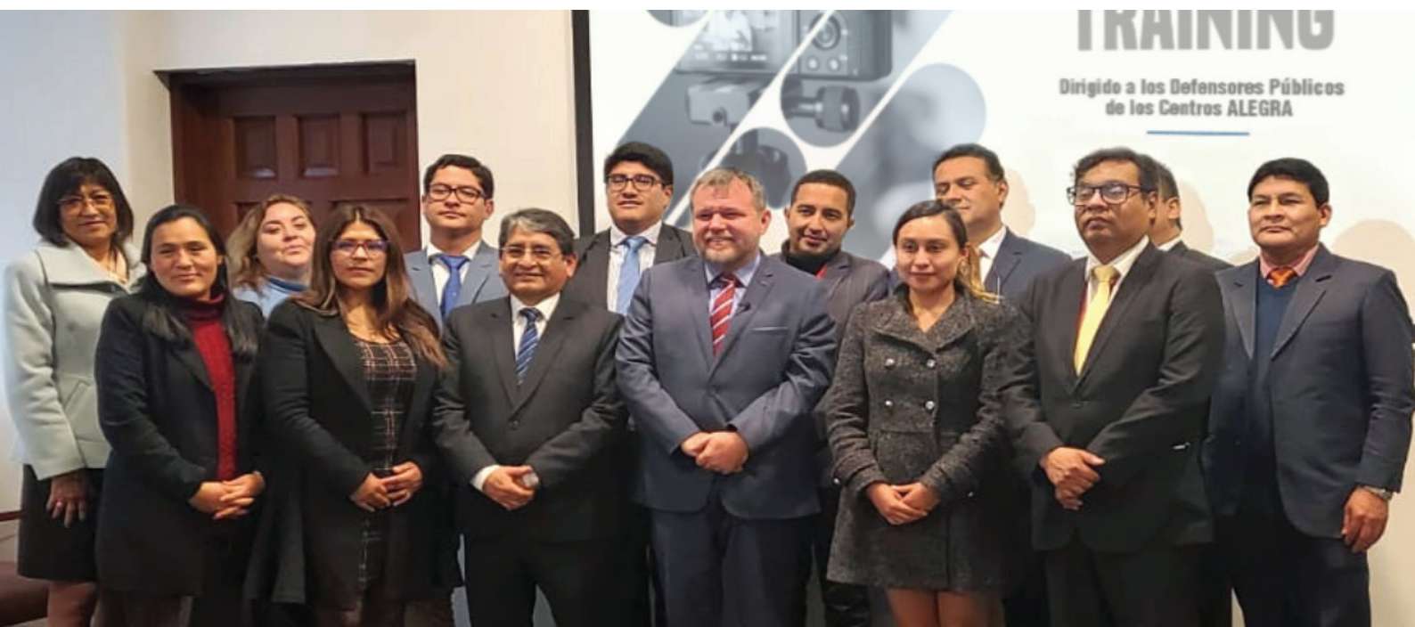
Clausura del taller de Media Training ofrecido por el Programa Eje no Penal gracias al apoyo financiero del Banco Mundial.

“A través de este taller voy a poder comunicarme mejor con la población dando a conocer los servicios que brinda el Ministerio de Justicia y Derechos Humanos a través de los centros de asesoría legal gratuita ALEGRA”.