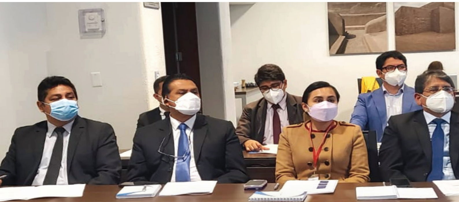
Chay tukuy imakunata tapunqa debe convertirse chay allin kaqman referente chay fuente chay tapusanta chay periodista nisqa .

Chay Directora chay Dirección chay tukuy imakuna chaskikunampaq Multidisciplinarios – DGDPAJ nisqa.