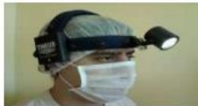
Imagen N° 08 – Lámpara referencial