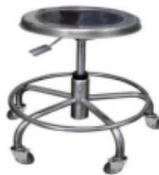
Imagen N°09 – Taburete rodable referencial