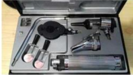
Imagen N° 07 – Pantoscopio referencial