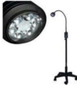
Imagen N°05 – Lámpara referencial