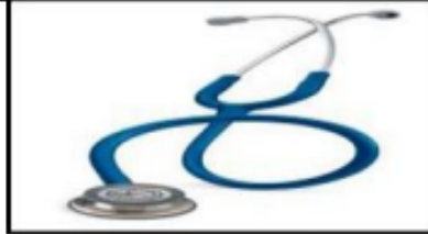
Imagen N°04 – Estetoscopio referencial