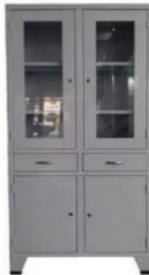
Imagen N°06 – Vitrina de Metal referencial.

Resistencia a la suciedad. Resistencia a la humedad.