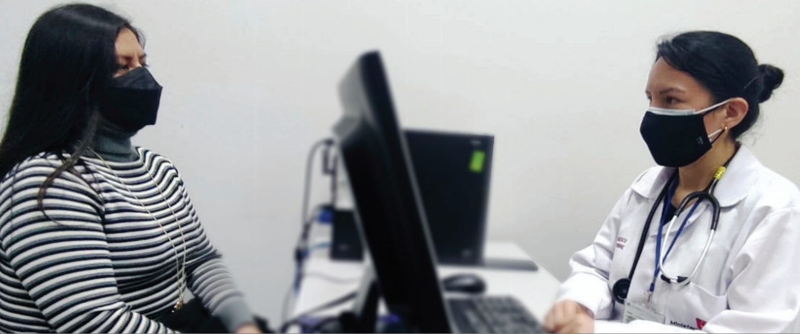
Chay tukuy imakuna ruwanmap adquiridos qoykunqa ancha tukuy imakuna willaykunqa chay kulluyachinqa chay allin kaqta chay Chay ukupi tukuy imakuna qelqasa tarikun periciales riqsichin.

gicos chay allin kaqkuna chay llankanampaq imakuna ruwanampaq chay /chay peritos psicólogos forenses paykuna sumaqta maskaykun constructos psicológicos específicos chay / chay runamasinchik chay chaskikunampaq chay qarkakuq llaqtamasinchikta , imayna chay caso chay allin yachaq , conductas agresivas, chaynalltaq chay personalidad nisqan.